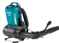
PDC direct - 36 V UB002C Akumulatorska ranac duvaljka